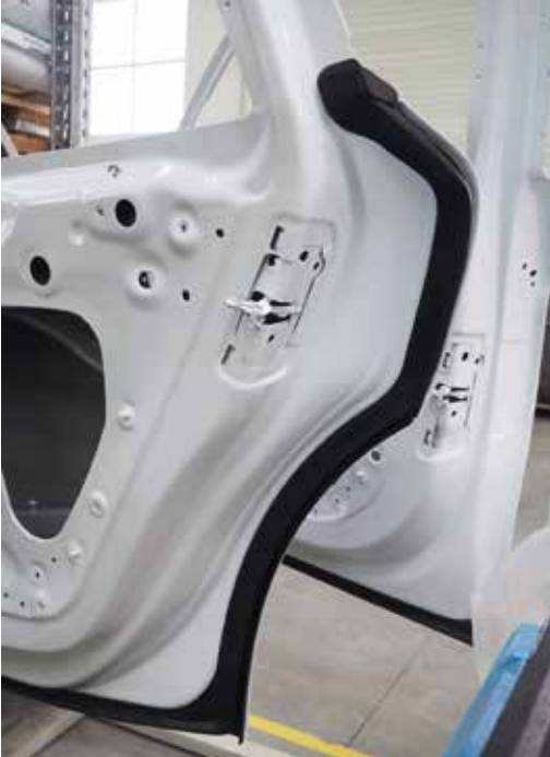
Die Dichtungselemente für die Seitentüren des Porsche Panamera werden als reines TPE-Teil gespritzt

seite.“ Nach einigen Gesprächen war der Abschluss nur noch Formsache.